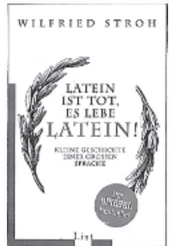
Titelbild eines modernen, unterhaltenden Buches über die Lebensgeschichte der Sprache Latein.

Ganze der gymnasialen Bildung muss betrachtet werden. Wenn ich an meine eigene Schulzeit in Aarau zurückdenke, so erinnere ich mich besonders dankbar an den Musikunterricht der Bezirks- und Kantonsschule. Was ich als Pianist, Klarinetist und Madrigalsänger gelernt habe, ist unbezahlbar. Ich fürchte, dass heute alles das weggespart wird. Im Zentrum der Gymnasialstudien steht für mich die Muttersprache (Mundart und Hochsprache). Entscheidend ist die Fähigkeit, etwas zu verstehen und sich auszudrücken. Neben der Muttersprache steht die Mathematik. Ich habe leider den Zugang nie gefunden, sehe aber, wie wichtig es ist, die Zahlen und ihr Wesen zu erfassen. In diesem Ganzen verdienen auch Latein und Griechisch einen festen Platz.»